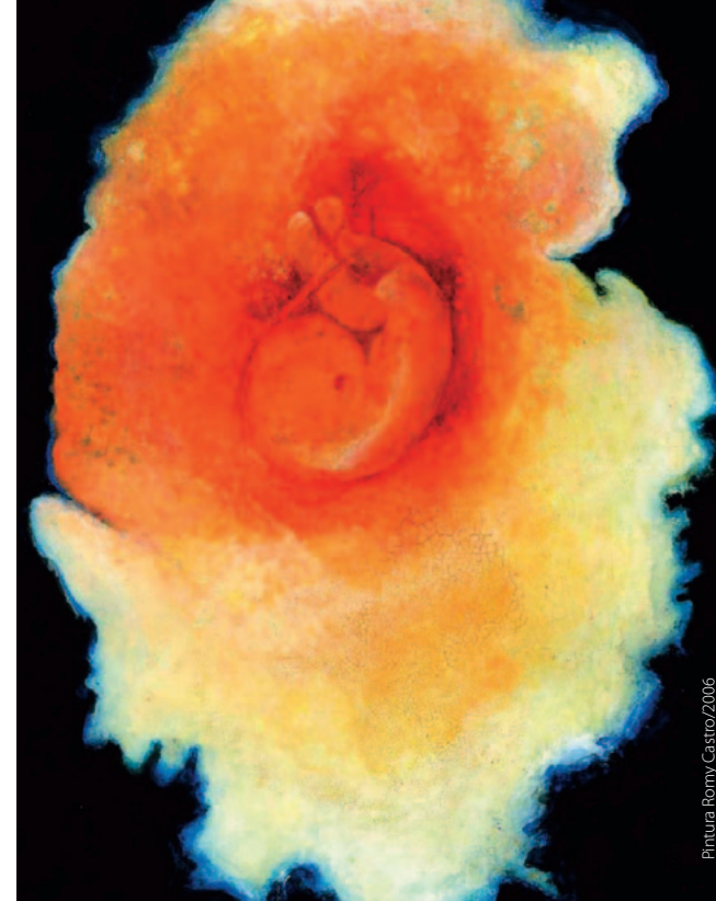
Pintura Romy Castro/2006

REUNIÃO CIENTÍFICA da Sociedade Portuguesa de Obstetrícia e Medicina Materno-Fetal